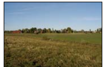
Rya, sydost om Lindsberg.