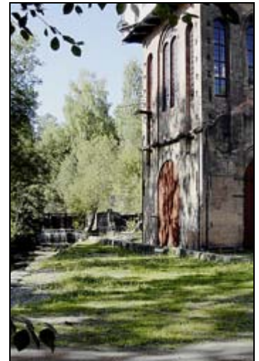
Lienshyttan vid Riddarhyttan.