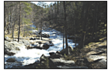
Fallet vid Skräddartorp.